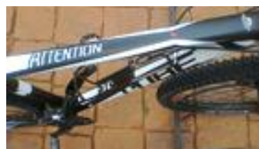
Cube Attention SL29 MTB 29" et 30 vitesses

Nous proposons des départs des petits groupes des cyclistes samedi le 18 Mars, 8 et 29 Avril, 13 et 27 Mai, 17 Juin, 1, 15 et 29 Juillet, 12 et 26 Août, 9 et 23 Septembre, 7 et 21 Octobre 2017 à Antananarivo. Nos groupes 2018 samedi 24 Mars et 14 Avril 2018 à Antananarivo.