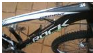
Rock Machine Torrent 70 MTB 29" et 30 vitesses